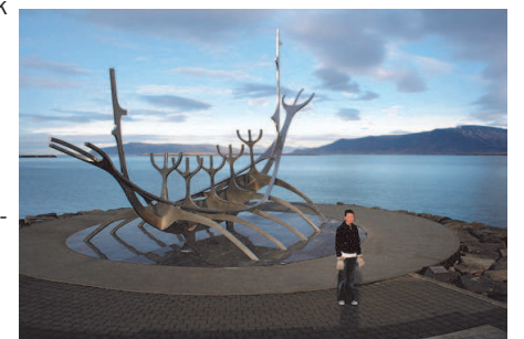
Skilafrestur á útdráttum á 9. ráðstefnu um fjölskylduhjúkrun. IFNC hefur verið framlengdur til 12. janúar. 2009. www.ifnc2009.com